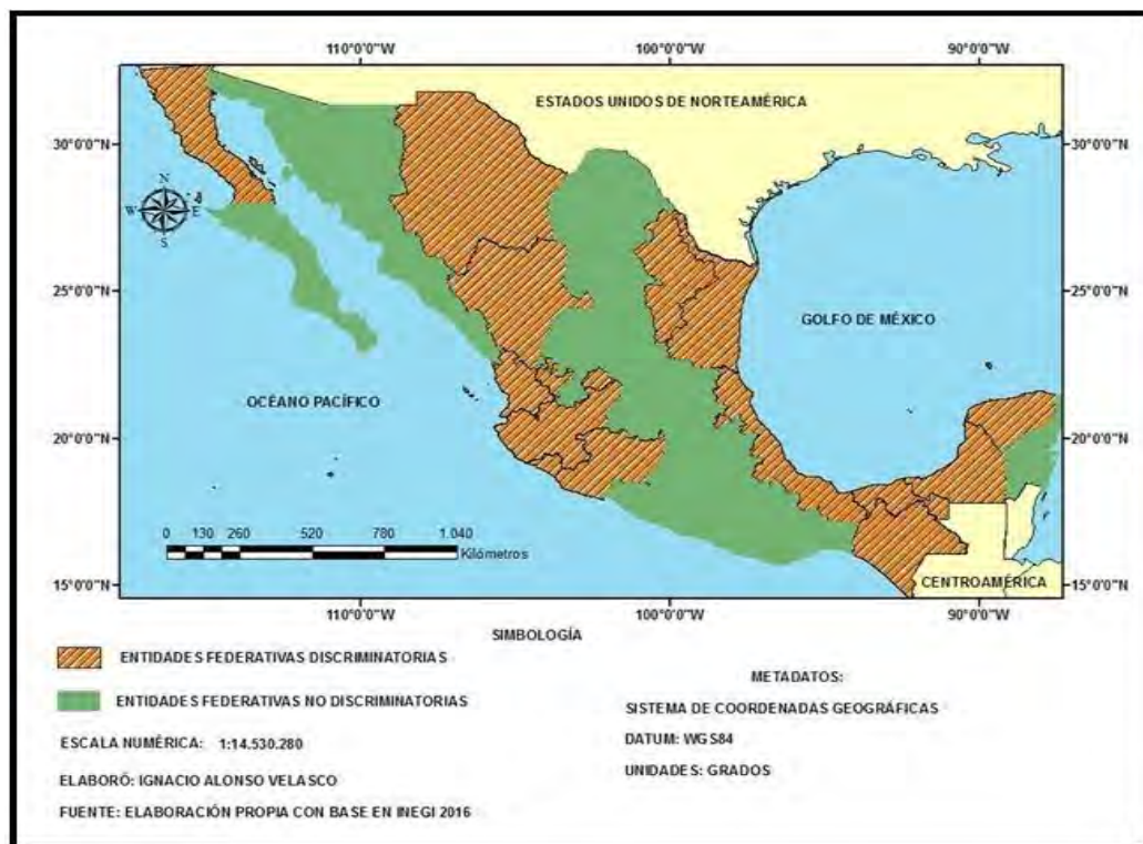
Mapa 2. Distribución geográfica de las entidades federativas en función de si exigen o no, en sus constituciones locales, ser nativo mexicano para poder aspirar a una diputación local

En el Mapa 2 se ilustra cómo están repartidos los estados que pertenecen a ambos bandos. De la comparación de dicha figura con la anterior, se puede evidenciar que hay algunas entidades federativas que guardan una coherencia en el sentido de que son discriminatorias o no, tanto para ser miembro de ayuntamiento, como para ocupar una diputación local, entidades como Aguascalientes, Baja California, Baja California Sur, Campeche, Chiapas, Coahuila, Colima, Guanajuato, Guerrero, Hidalgo, Michoacán, Morelos, Nayarit, Nuevo León, Oaxaca, Puebla, Querétaro, San Luis Potosí, Sonora, Tabasco, Tamaulipas, Tlaxcala, Yucatán y Zacatecas. Sin embargo, hay seis estados (Veracruz, Jalisco, Durango, Chihuahua, Quintana Roo y Estado de México) que no tienen una postura clara y se muestran arbitrarios o antojadizos al respecto, pues no siguen un criterio único a la hora de establecer los mismos requisitos de oriundez para ser miembro de un ayuntamiento que para obtener una diputación.