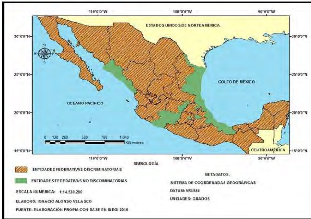
Mapa 3. Distribución geográfica de las entidades federativas en función de que requieran o no, en sus constituciones locales, ser oriundo de México para ostentar una gubernatura