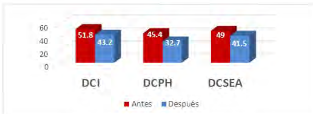
Figura 2. Índice de reprobación por división académica.