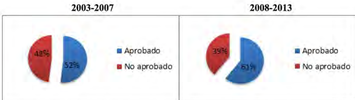
Figura 1. Índice de reprobación previo y posterior a la inclusión del inglés como asignatura general.

Esta disminución se refleja también al hacer la comparación entre las tres divisiones académicas (Figura 2):