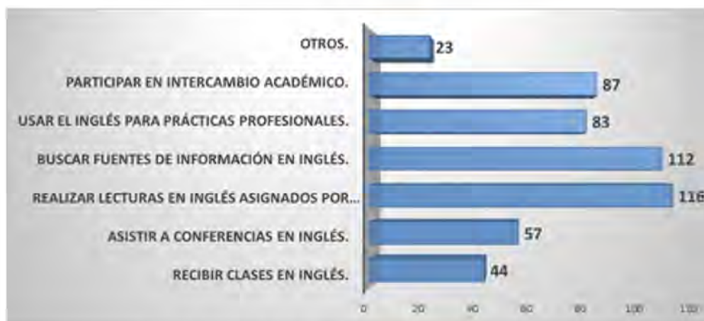
Figura 4. Utilidad del inglés para su formación académica.